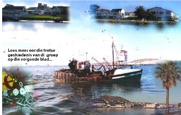
Lees meer oor die trotse geskiedenis van di groep op die volgende blad...