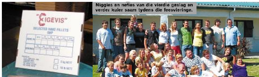
Niggies en nefies van die vierdie geslag en verder kuier saam tydens die feesvieringe.