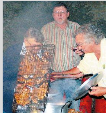
Familie kuier: Ooms, lantes, oumas, niggies en neefs – die Eigelaaar-familie het saam gekuier. Saterdag 12 April is bootritte aan-gebied tussen die Laaiplek en Riviera Hotelle. Op Vrydag 11 April het die familie saam gebrail op Sandboskraal.