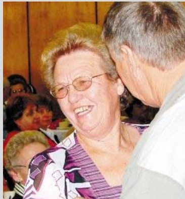
Seniors saam stout: Die plaaslike gemeenskap het gedeel in die feesvieringe. Donderdag 10 April is 'n oggendtee aangebied in Velddriif se stadsaal vir die senior burgers van Aan Oewer Dienssentrum.